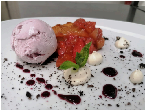
Le financier haut en couleurs et en saveurs

Bien évidemment, cela occasionne des désagréments dans le jeu, beaucoup de travail pour l'équipe Terrain ainsi qu'un coup financier important mais indispensable pour la survie de nos greens !