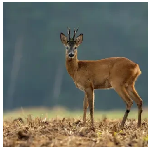
Chevreuil d'Europe (Capreolus capreolus)

Une petite famille se retrouve souvent en fin de journée, sur le neuvième trou du parcours Blanc.