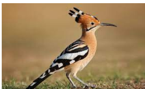
Huppe fasciée (Upupa epops)

Elle vous accueillera en matinée, en terrasse du restaurant et vous accompagnera lors de vos séances sur le Practice.